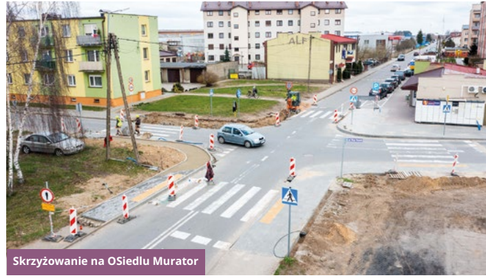
Skrzyżowanie na Osiedlu Murator