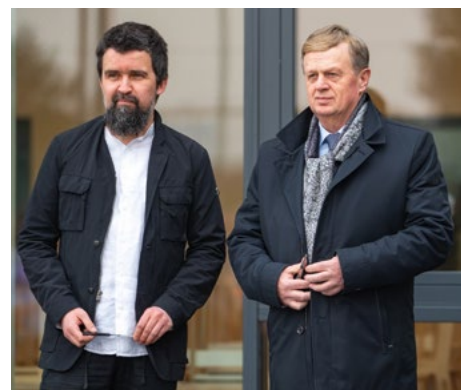
Projektant i generalny wykonawca naszej „Bajki”