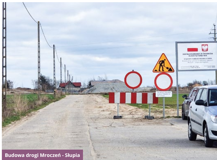
Budowa drogi Mroczeń - Słupia