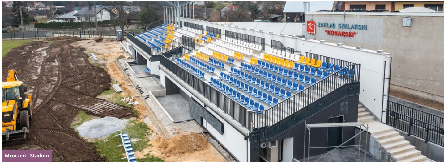
Mroczeń - Stadion