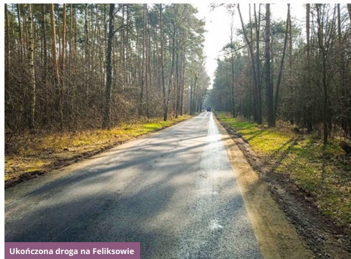
Ukończona droga na Feliksowie