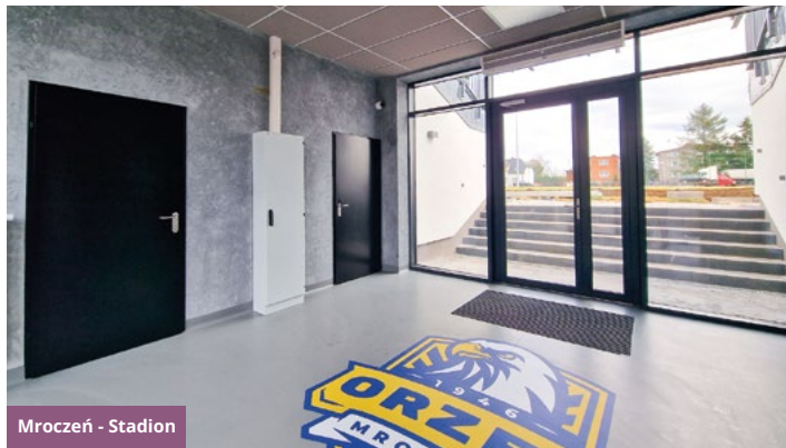
Mroczeń - Stadion