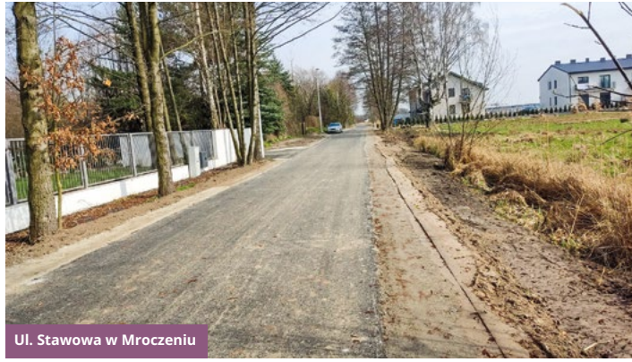
Ul. Stawowa w Mroczeniu