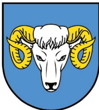
Nowy herb Gminy Baranów

Okazało się, że Gmina Baranów posługiwała się do tej pory herbem, flagą oraz pieczęciami, które nigdy nie zostały zaopiniowane przez Komisję Heraldyczną. W tej sytuacji Wójt Gminy skierował wniosek do Ministra Spraw Wewnętrznych i Administracji o wyrażenie opinii o projektach przedstawionych przez nasz Urząd. 8 kwietnia 2019 r. otrzymaliśmy pozytywną opinię i wówczas Rada Gminy mogła wreszcie podjąć stosowną uchwałę w sprawie. Mamy więc wreszcie pewność, że nasz herb, flaga i pieczęć są zgodne z zasadami heraldyki, weksylologii oraz miejscową tradycją historyczną. (es)