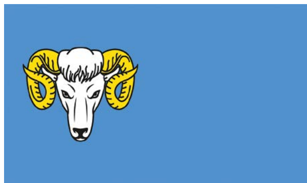
Nowa flaga Gminy Baranów