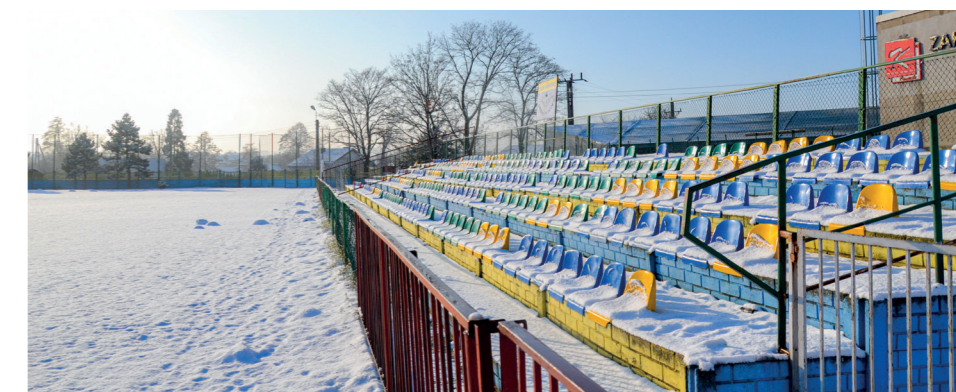
Trybuna może zostać w każdej chwili zamknięta przez nadzór budowlany

rocznicę powstania. Najstarszy klub sportowy w Gminie Baranów nie czekał się niestety swojej siedziby. Klub prowadzi obecnie drużynę seniorów na szczelu V ligi i rywalizuje z drużynami z byłych województw: konińskiego, leszczyńskiego oraz kaliskiego. Dodatkowo w klubie istnieją cztery drużyny młodzieżowe, uczestniczące w rozgrywkach wojewódzkich w kategoriach: junior starszy, tramp-