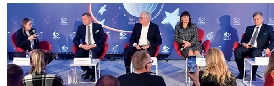
Debata na temat Rankingu Finansowego Samorządu Terytorialnego podczas VI Europejskiego Kongresu Samorządów w Mikołajkach