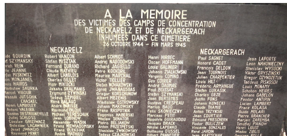
Tablica ku czci ofiar tego obozu

Całość na facebook.pl Baranów. Witryna Sołecka