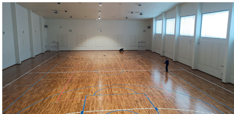
Parkiet już jest - wkrótce cała reszta

Zamontowano profesjonalną tablicę do koszykówki o wymiarach 180x105 cm, wykonaną ze szkła hartowanego o grubości 10-12 mm. Hala sportowa wyposażona została w podstawowy sprzęt gimnastyczny: drabinki i drążki,