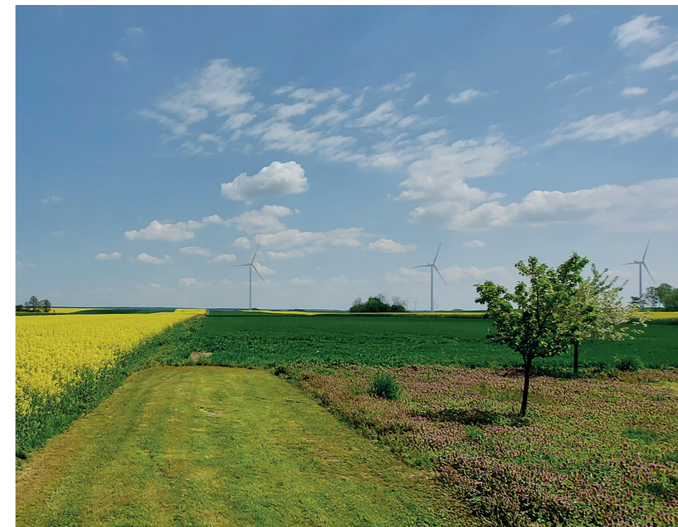
Wizualizacja przyszłej farmy wiatrowej

Mieszkańców nie opuszczają jednak wątpliwości – pojawiają się obawy o hałas, jaki spowodują wiatraki oraz zagrożenie, jakie stanowią one dla nietoperzy i ptaków. Tymczasem zarówno władze gminy jak i firma VSB zapewniają, że Park Wiatrowy uło-