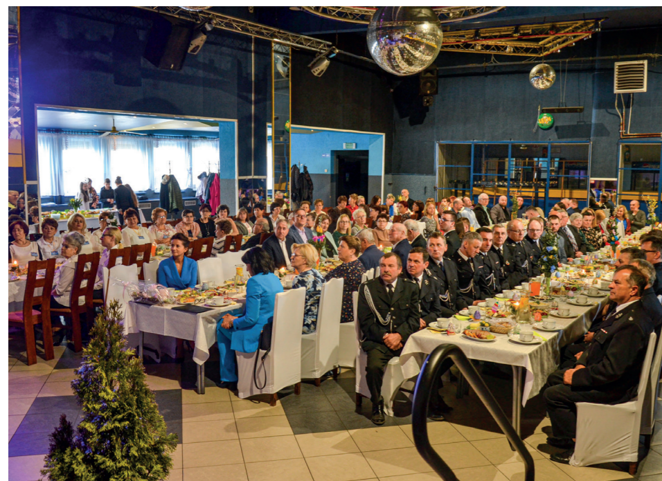
Do Świątecznego stołu licznie zasiedli zaproszeni goście