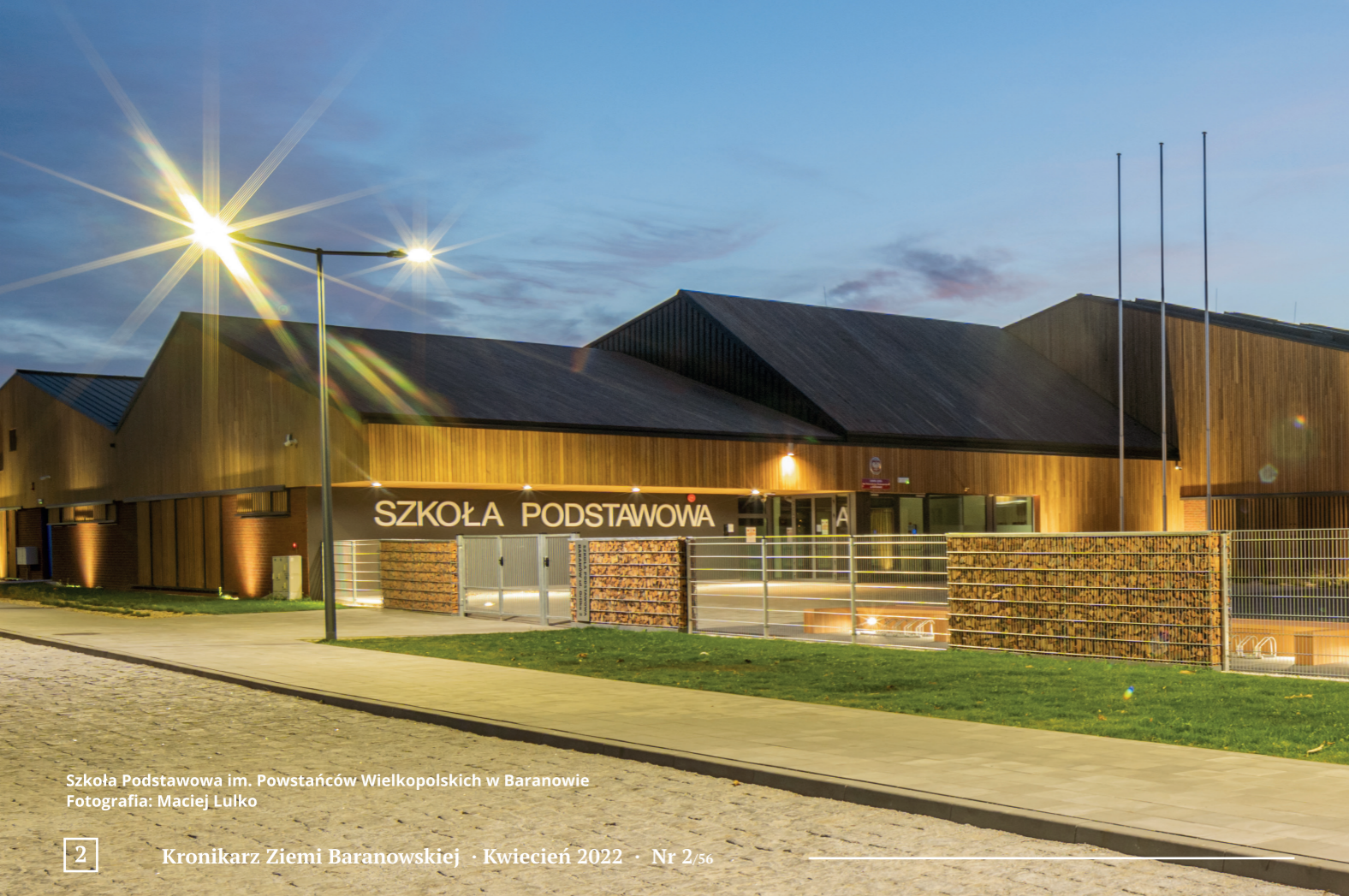
Szkoła Podstawowa im. Powstańców Wielkopolskich w Baranowie

kieruje ciężkie i wielkogabarytowe samochody na drogi do tego przystosowane. Wraz z budową obwodnicy ruszyła inwestycja realizowana przez obcego inwestora pod nazwą „ Pasaż Handlowy ” w Baranowie. Można zauważyć, że podmokły grunt pod tę inwestycję jest osuszany, nawieziono piach, wkrótce będą wylewane ławy pod budynki, które tam powstaną.