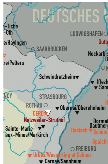
Lokalizacja obozu Natzweiler-Struthof w Alzacji. Dziś ta miejscowość leży we Francji.

czeń na kapo co zupę wydawał: Czy to ma być zupa na obiad? Zaraz zjawił się komendantfuhrer lagru (dowódca wszystkich strażników) i on do niego z pistoletem i tamten też z pistoletem. Klótnia jak sto diabłów. Ale ten nowy już nogami tę zupę zdążył powylewać. Ten, co przyjechał, to był nadinspektor budowy. I gdy się klóćli, ten od nas mówił, że jest za nas odpowiedzialny. A ten drugi mówi: Ja przed fuhrerem jestem osobiście odpowiedzialny za ter-