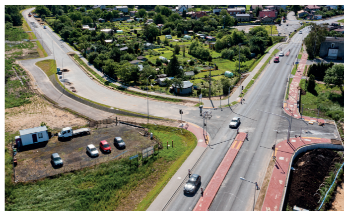
Obwodnica Baranowa - zakończenie 31.07.2022 r.