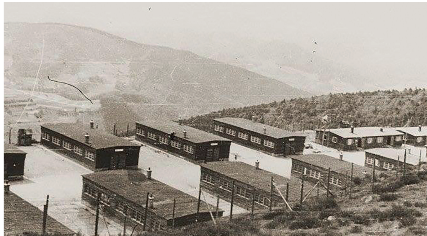
Obóz na zboczu góry

ła się wspinaczka. (...) Ludzie drzemali, bo każdy syty i nikt przez całą drogę słówkiem się nie odezwał. Wreszcie wspinaczka mocno złagodniała i po krótkim czasie jesteśmy przed bramą następnego lagru.(...)