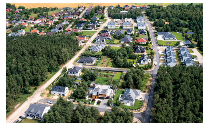
13 ulic na Muratorze - zakończenie 31.07.2022 r.