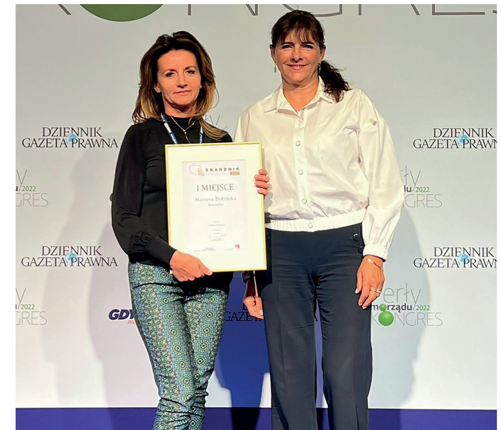
Wójt i Skarbnik odbierają nagrody podczas Gali „Perły Samorządu” w Gdyni