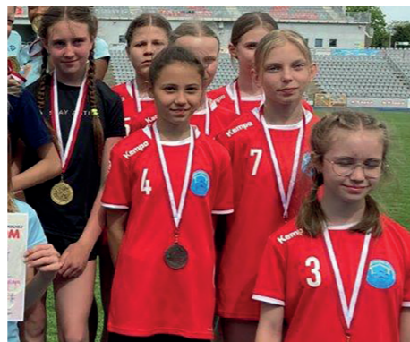
Srebrne Czwórboistki z Baranowa